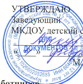
График сменности работников

Муниципального казенного дошкольного образовательного учреждения детский сад №12 пгт. Атиг